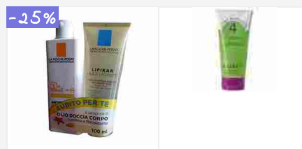
Anthelios XL SPF50